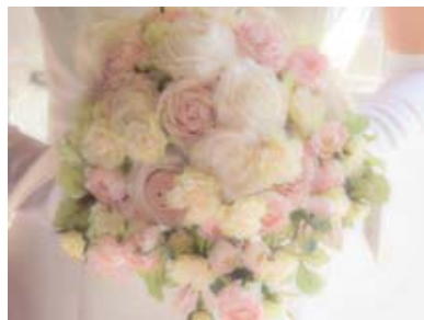
↑ウェディング 静止画／動画