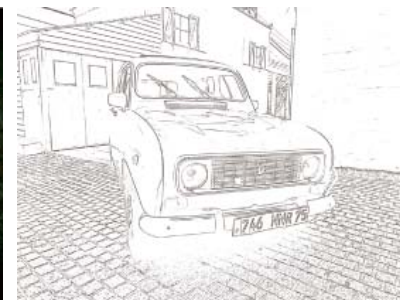
↑スケッチ 静止画／動画