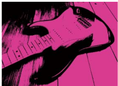
↑ロック 静止画／動画