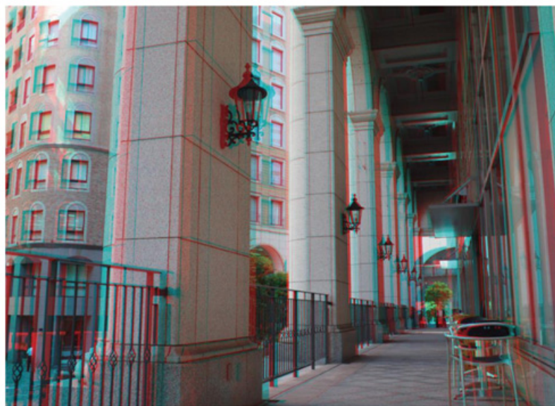
3Dフォト レッド&シアン画像

同梱の専用メガネで3Dを楽しむアナグリフ方式の3Dフォト撮影&表示機能。 3D対応のTVがなくても、カメラモニターやテレビ、プリントしても気軽に3Dフォトが楽しめます。