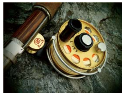
↑ピンホール 静止画／動画