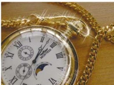
↑クリスタル 静止画