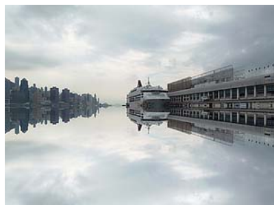
↑ミラー 静止画／動画

多彩な画像が簡単に撮影できる「マジックフィルター」。撮影するシーンや表現したいイメージにあわせてフィルターを選べば、楽しさや驚きでいっぱいの写真になります。