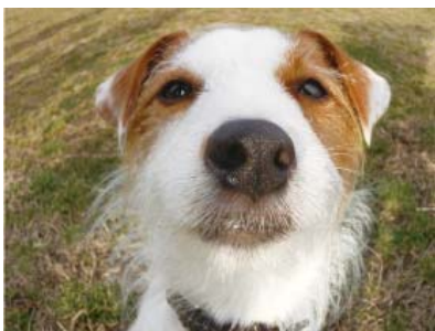
↑フィッシュアイ 静止画／動画