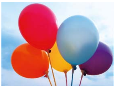
↑ポップ 静止画／動画