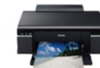
プリント (赤青3D表示)